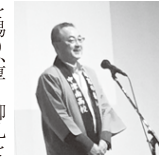
去る10月9日(日)、ヴィアージュにて開催しました令和4年度「同窓のつどい」に際し、会員の皆様には多大なるご理解とご協力を賜り、厚く御礼を申し上げます。

私たちは令和元年10月の「同窓のつどい」終了後、37回生の先輩方より親切丁寧な引継ぎを受けました。その後実行委員会を立ち上げ、同年12月には最初の定例会を開き準備を進めて参りました。更に同級生への周知とスタッフ確保のため、翌年1月に38回生の同窓会を開きました。遠くは関東や関西からも参加があり、「同窓のつどい」に向けて機運を高める良い機会となりました。しかし2月に入り新型コロナウイルス感染拡大の影響で世の中の自粛ムードが高まり、対面での実行委員会の開催が困難を伴うこととなりました。4月には「同窓のつどい」の延期が決定し、実行委員会も暫しのお休みとなりました。