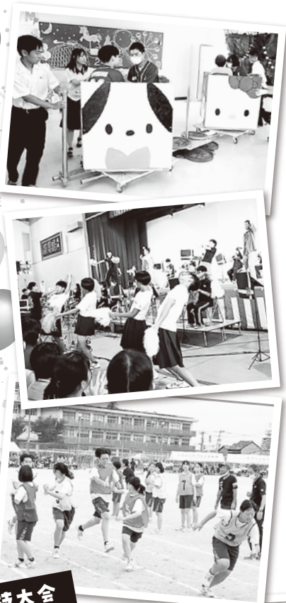
南北親善球技大会